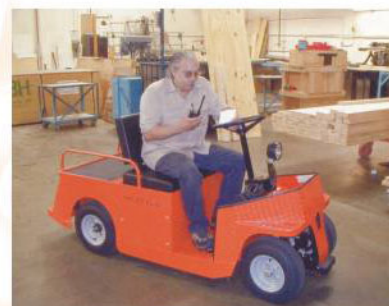
Economique et maniable