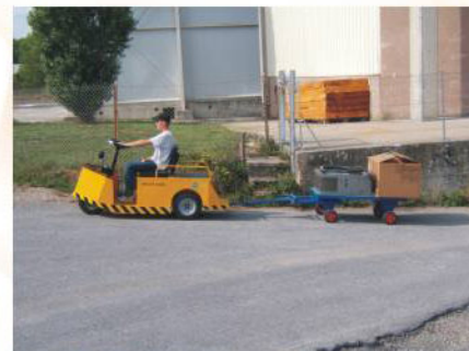
Existe en version 3 roues